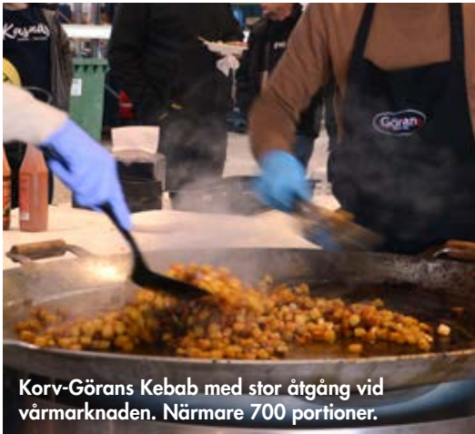
Korv-Görans Kebab med stor åtgång vid vårmarknaden. Närmare 700 portioner.