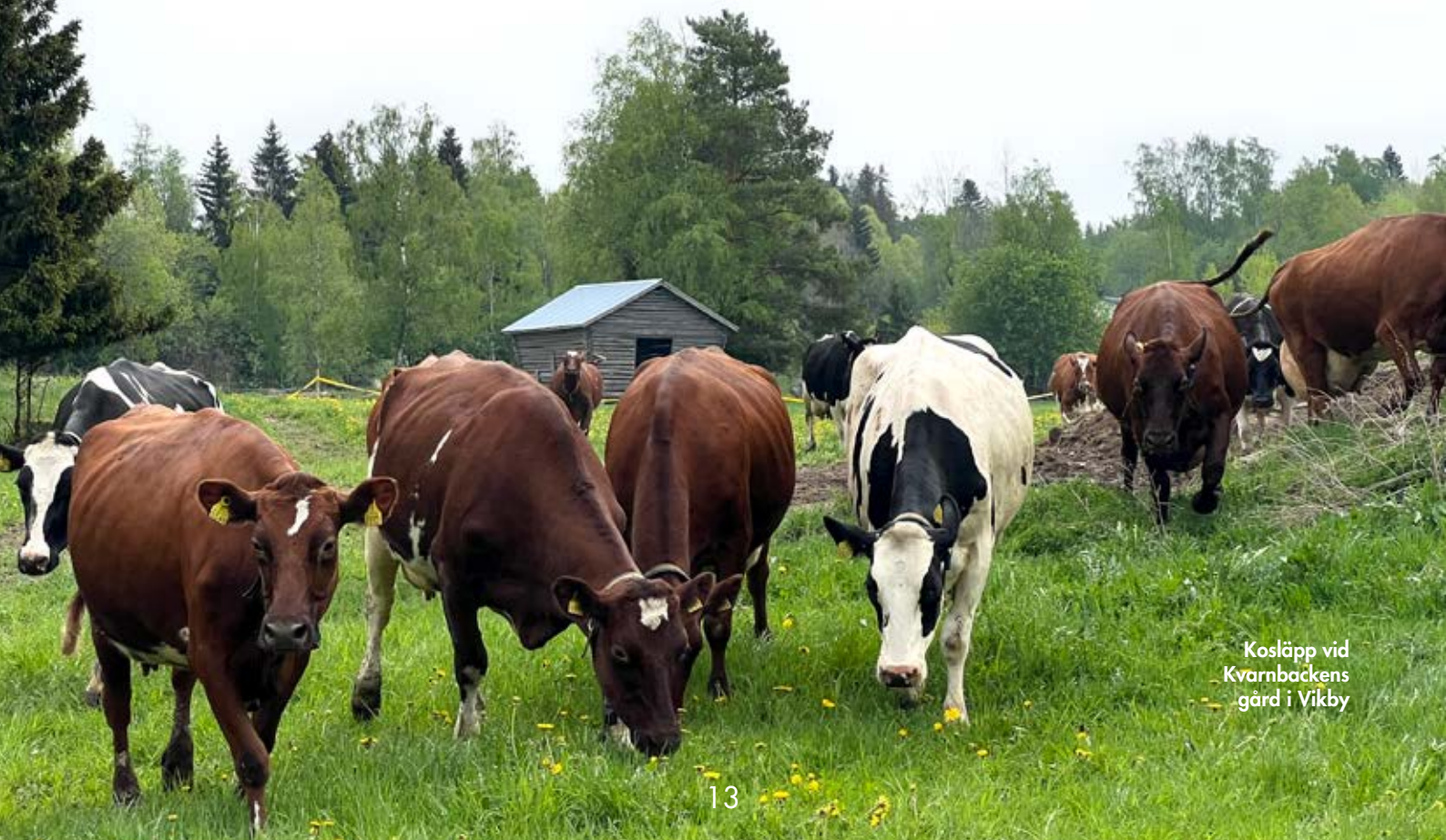
Kosläpp vid Kvarnbackens gård i Vikby