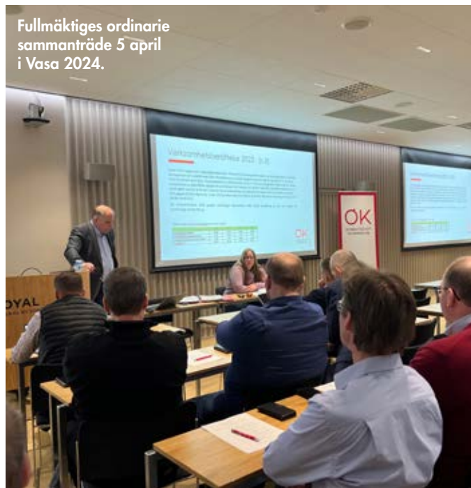
Fullmäktiges ordinarie sammanträde 5 april i Vasa 2024.