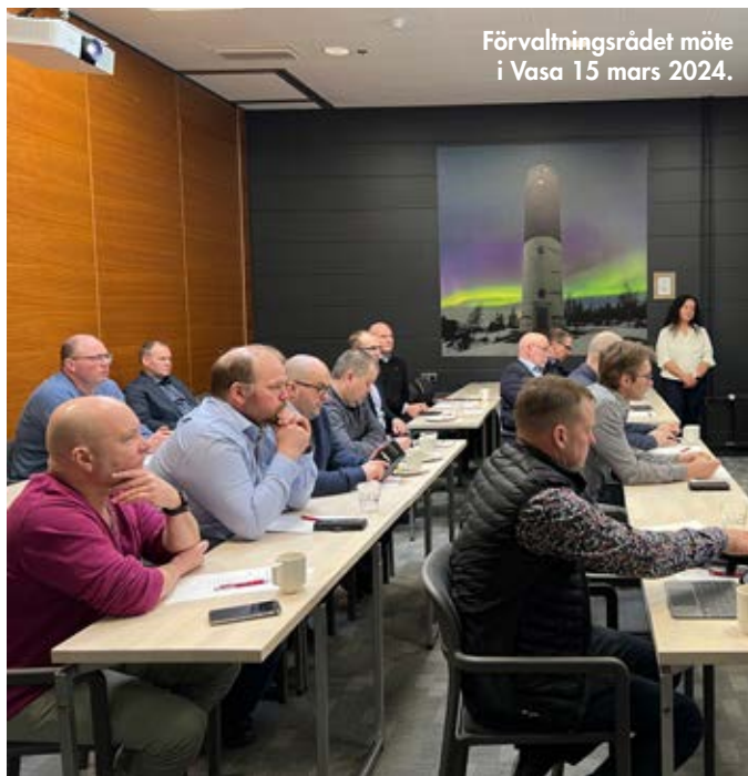
Förvaltningsrådet möte i Vasa 15 mars 2024.