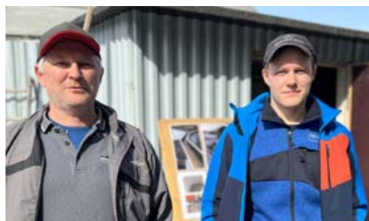
Far och son Smeds från Malax.