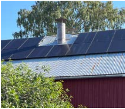
42 solcellspaneler har installerats på taket. Riktigt nytt.