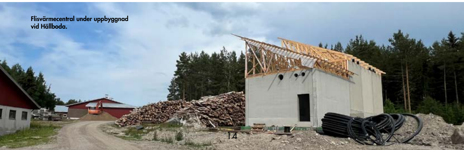
Flisvärmecentral under uppbyggnad vid Hällboda.

Han köper komponenter från A-Foder och odlar själv 230 hektar korn, havre och ärter plus idkar naturvård. Till sin hjälp i arbetet har han en anställd i svinhuset och