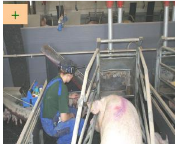
Porsaiden tarkkailua porsitusosastossa